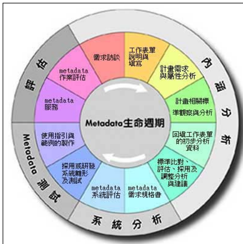
圖 1 後設資料(Metadata)生命週期作業模式