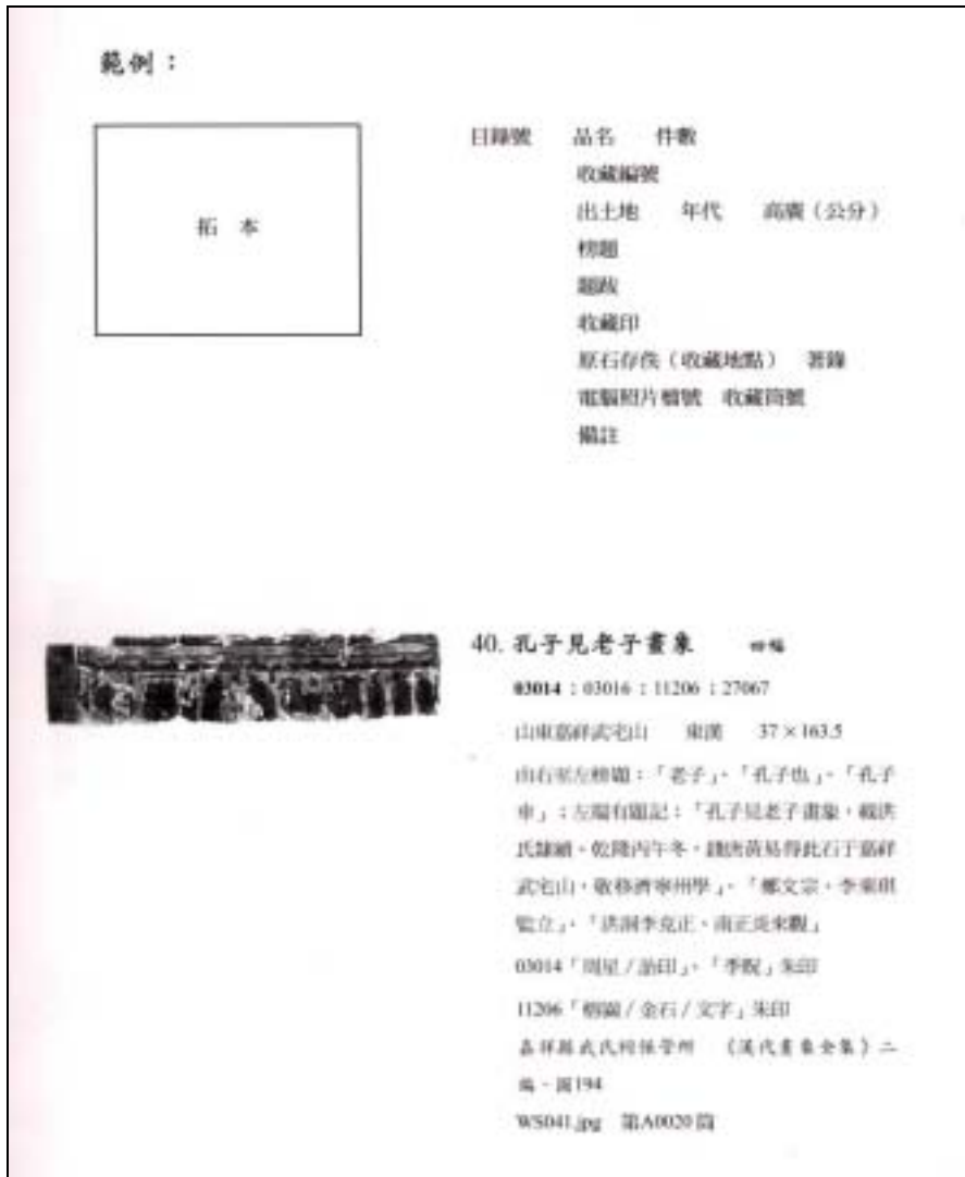
圖三 《中央研究院歷史語言研究所藏漢代石刻畫象拓本目錄》範例