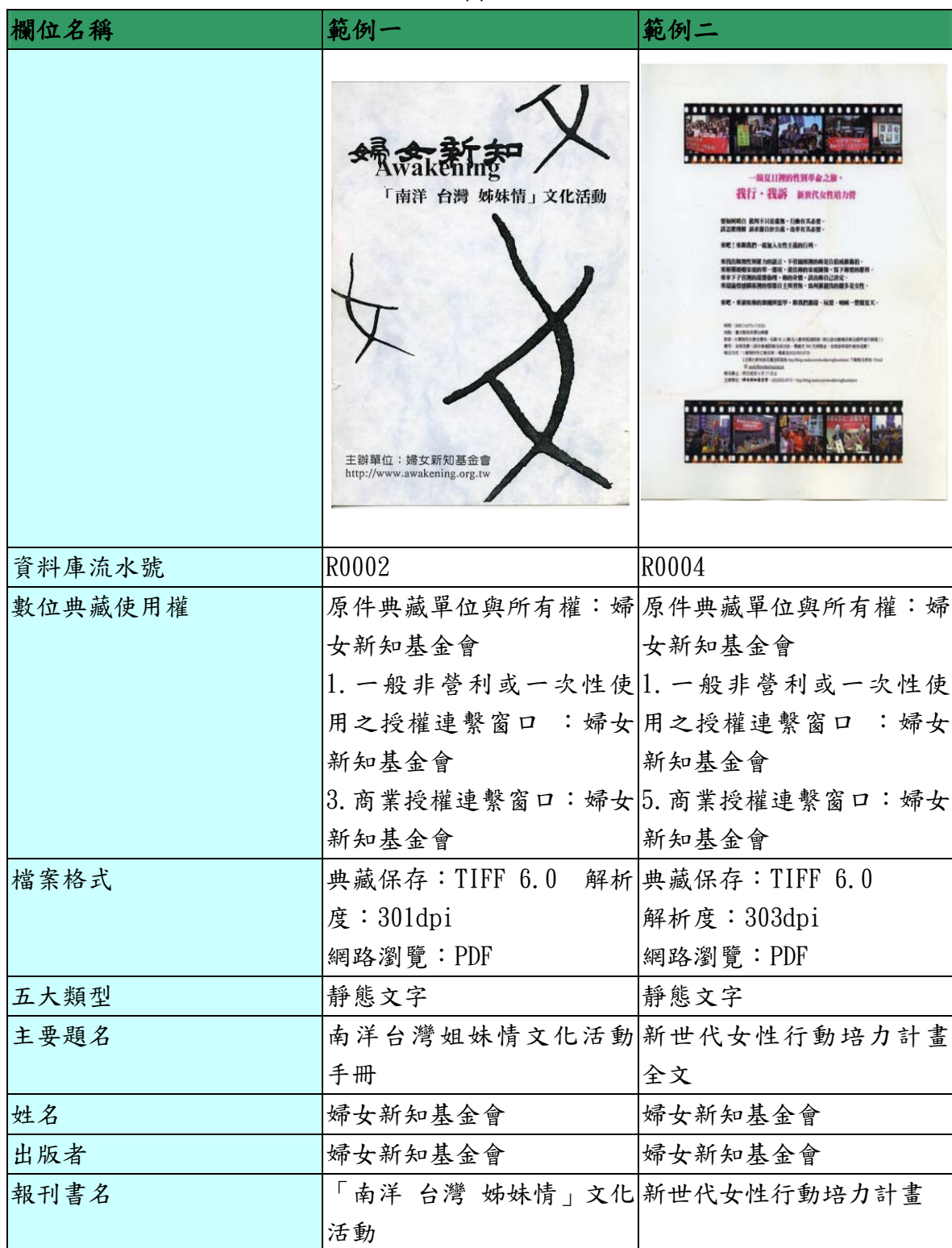
表一、「台灣婦女新知運動史料資料庫建置與數位典藏計畫 (IV)」資料庫欄位及範例表

後設資料工作組依據「台灣婦女新知運動史料資料庫建置與數位典藏計畫(IV)」於 2012-04-02 提供的欄位及範例，整理出計畫欄位及範列表，請見表一。