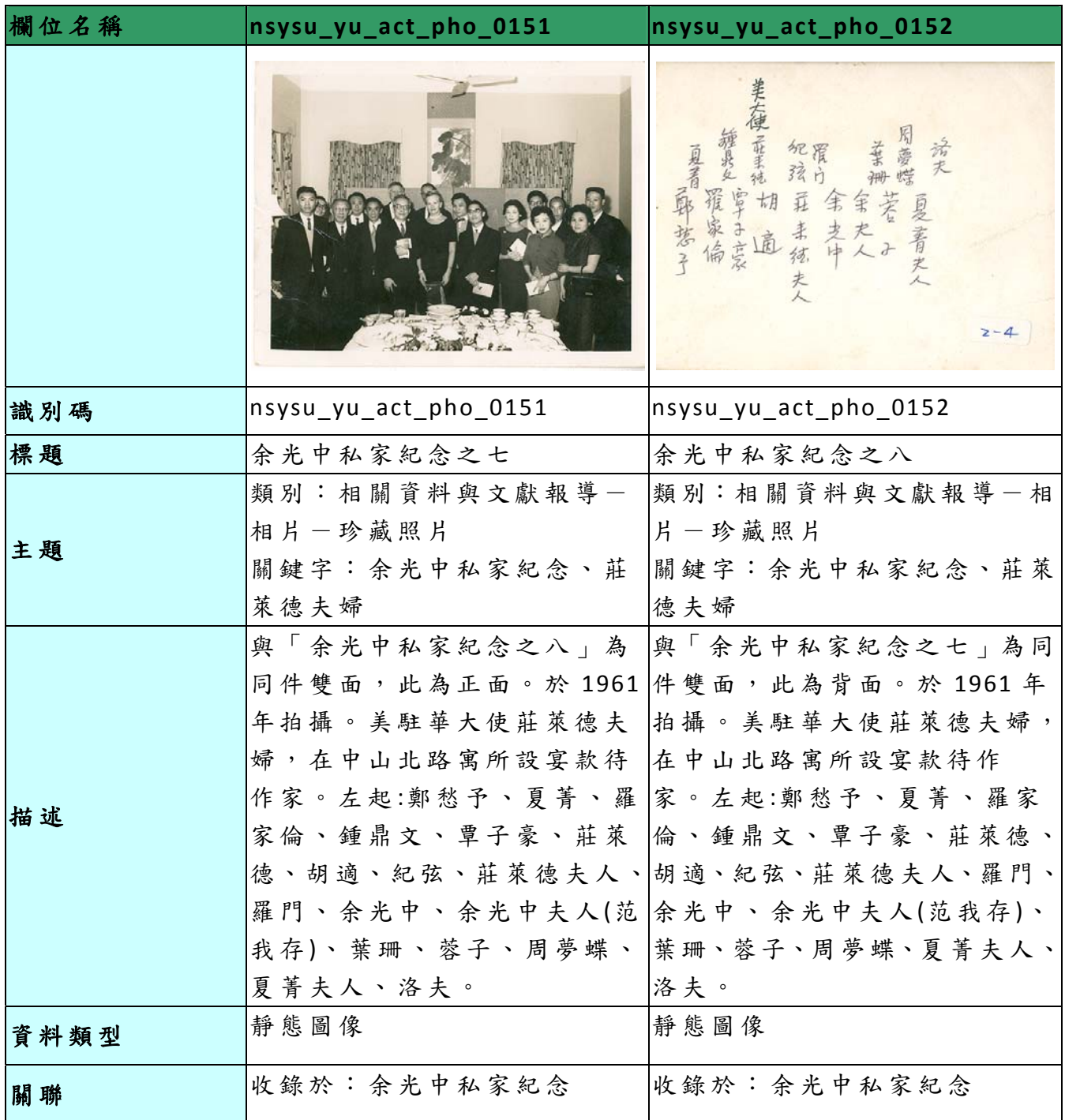
表一、「臺灣書寫，世界發光：余光中數位典藏計畫(照片)」 資料庫欄位及範例表

「臺灣書寫，世界發光：余光中數位典藏計畫」主要典藏余光中珍貴照片、文物等，並透過數位化達到推廣與應用之目的。後設資料工作組依據「臺灣書寫，世界發光：余光中數位典藏計畫」於 2012-03-14 提供的欄位及範例，整理出「照片」之欄位及範例表，請見表一。