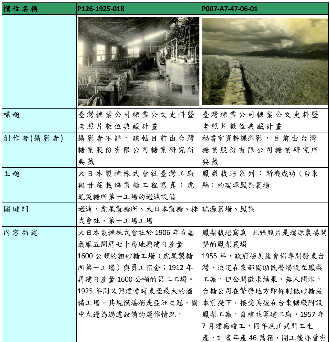
表一、「臺灣糖業公司糖業公文史料暨老照片數位典藏計畫」 資料庫欄位及範列表

「臺灣糖業公司糖業公文史料暨老照片數位典藏計畫」主要典藏台灣糖業珍貴老照片，並透過數位化達到推廣與應用之目的。後設資料工作組依據「臺灣糖業公司糖業公文史料暨老照片數位典藏計畫」於 2012-05-04 提供的欄位及範例，整理出「照片」之欄位及範列表，請見表一。