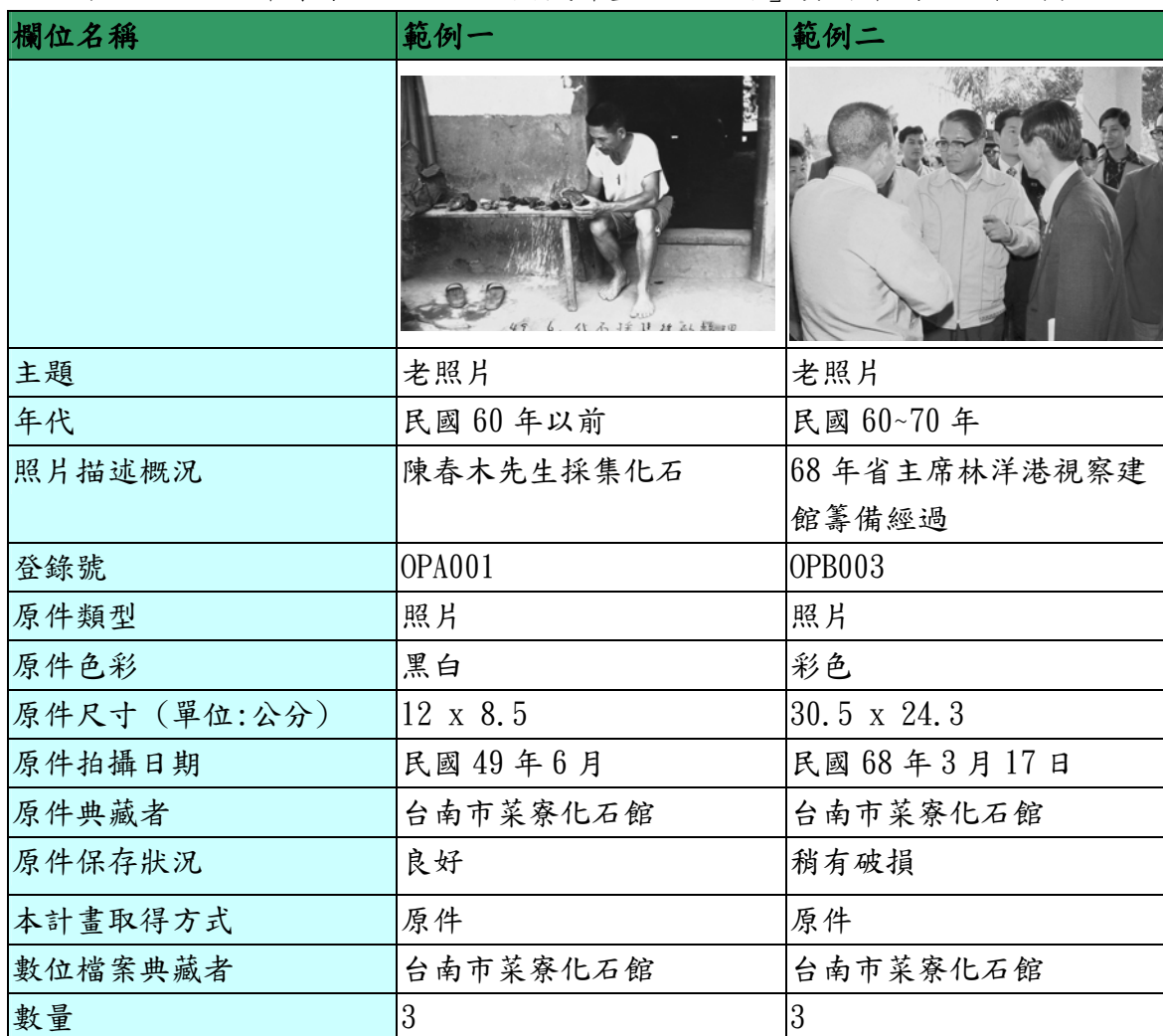
表一、「台南市菜寮化石館數位典藏計畫—老照片」資料庫欄位及範例表

後設資料工作組依據「台南市菜寮化石館數位典藏計畫」於 2012-03-23 提供的欄位及範例，整理出計畫欄位及範例表，請見表一。