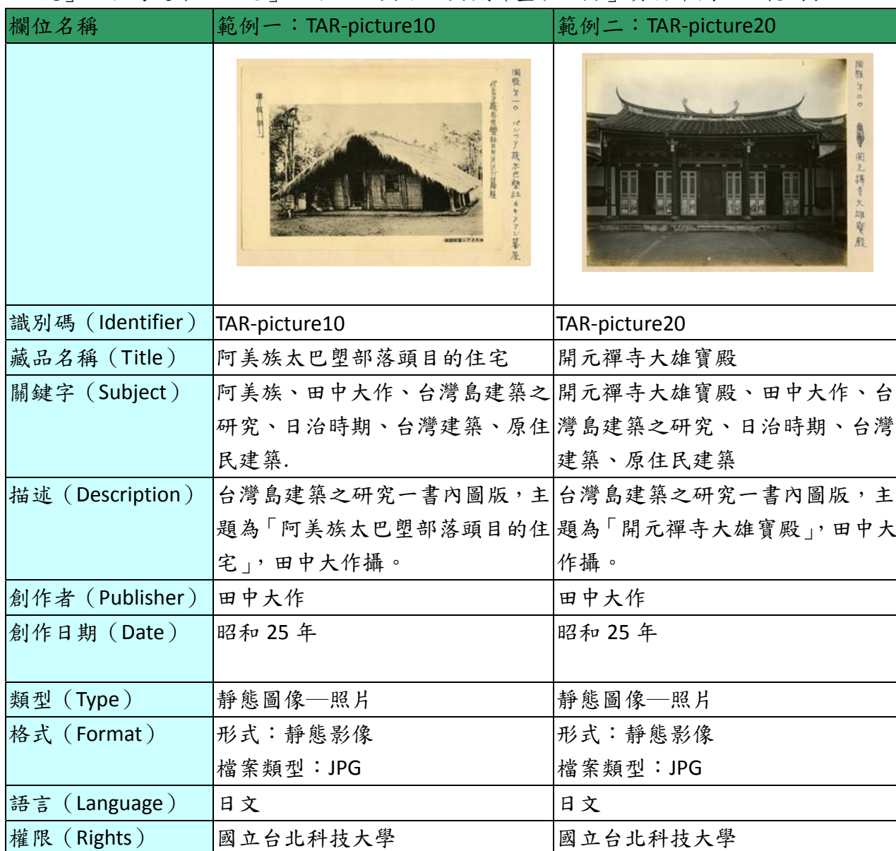
表一、「日治時期台北工業學校建築學者田中大作先生研究成果「台灣島建築之研究」、「台灣建築文化志」之中文化與數位典藏計畫(照片)」資料庫欄位及範例表

後設資料工作組依據「日治時期台北工業學校建築學者田中大作先生研究成果「台灣島建築之研究」、「台灣建築文化志」之中文化與數位典藏計畫」於 2011-07-25 提供的欄位及範例，整理出「原件內文」、「內文翻譯檔」、「手繪圖」、「照片」、四類藏品，「照片」之欄位及範例表，請見表 1。