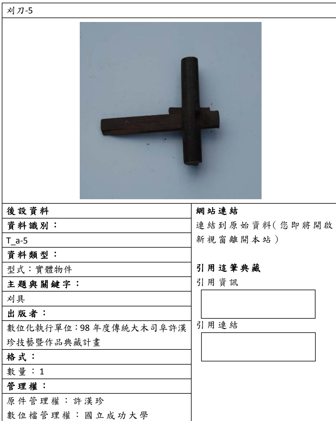
表五、聯合目錄網頁範例 - 營建工具