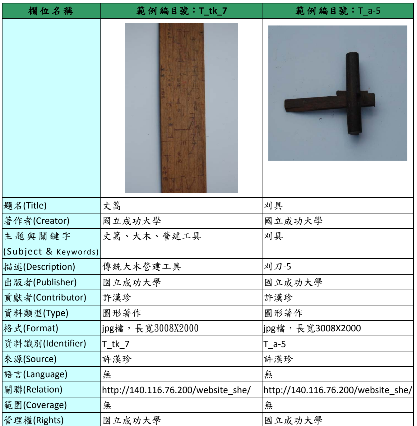
表 1、「98 年度傳統大木司阜許漢珍技藝暨作品典藏計畫-工具」資料庫欄位及範例表

「98 年度傳統大木司阜許漢珍技藝暨作品典藏計畫後設資料對照報告」主要典藏大木司阜許漢珍相關珍貴手稿、繪圖、建築、影片等藏品，後設資料工作組依據「98 年度傳統大木司阜許漢珍技藝暨作品典藏計畫」於 2011-06-23 提供的欄位及範例，整理出「手繪圖/手稿」、「工具」、「實體建築」、「影片」四類藏品，「營建工具」之欄位及範例表，請見表 1。