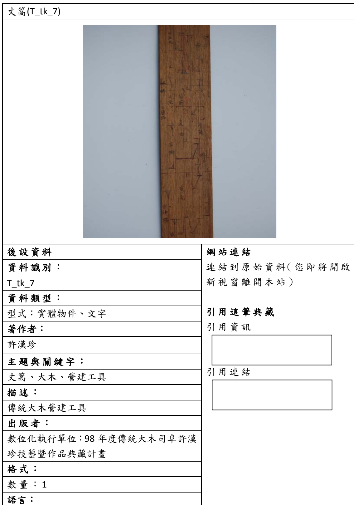
表四、聯合目錄網頁範例-丈篙

下列為資料對照至聯合目錄後，聯合目錄檢索結果之顯示版面。若無資料匯入的欄位，聯合目錄則不會顯示，請見表三。