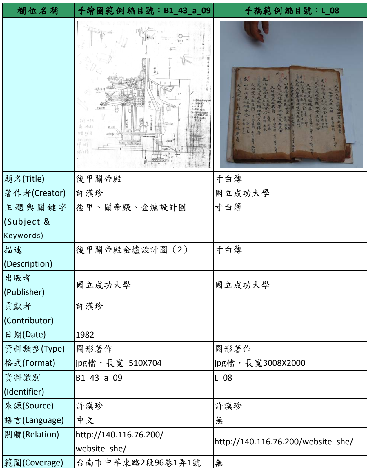
表 1、「98 年度傳統大木司阜許漢珍技藝暨作品典藏計畫-手繪圖/手稿」資料庫欄位及範例表