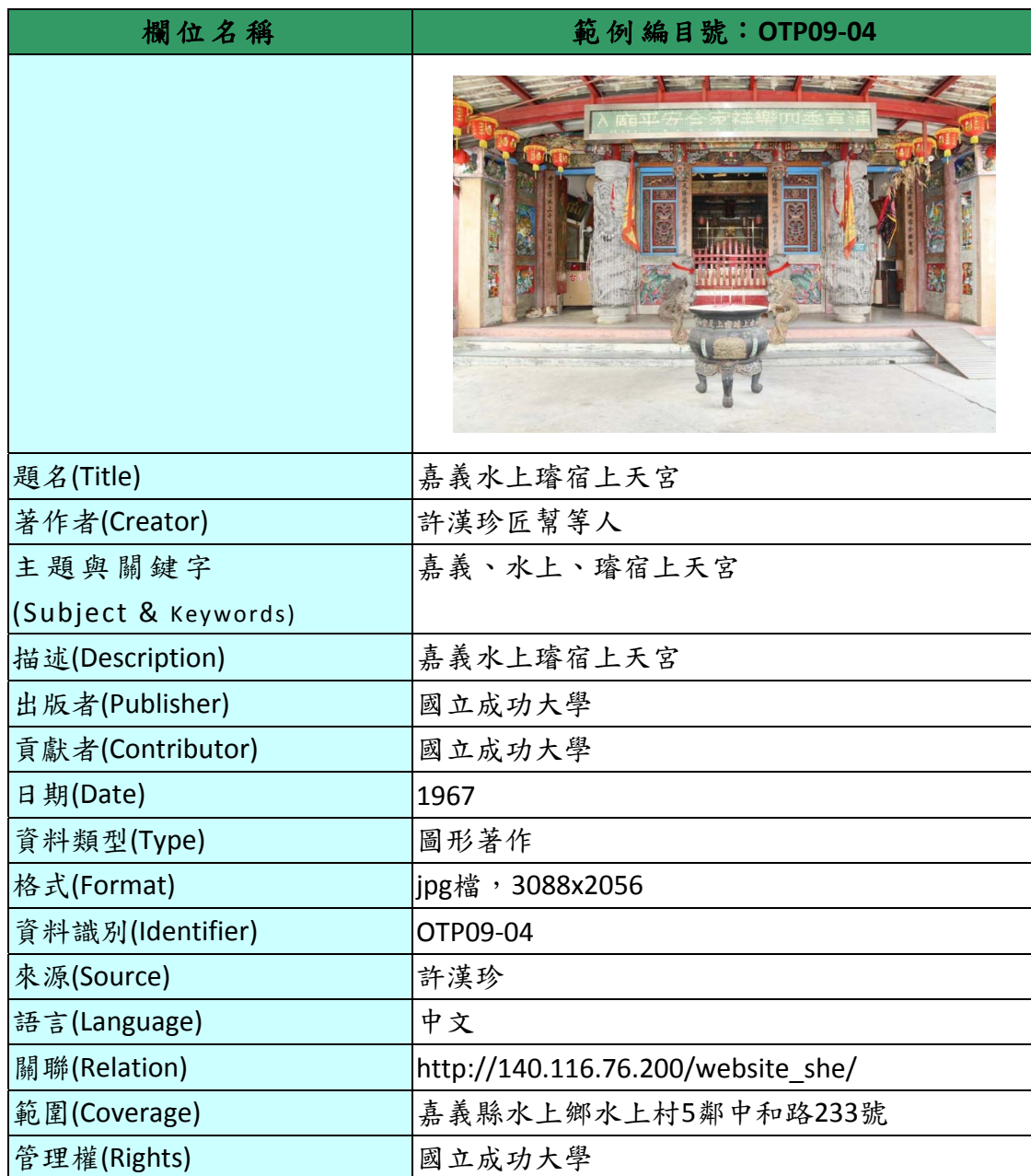
表 1、「98 年度傳統大木司阜許漢珍技藝暨作品典藏計畫-建築實體」資料庫欄位及範列表

「98 年度傳統大木司阜許漢珍技藝暨作品典藏計畫後設資料對照報告」主要典藏大木司阜許漢珍相關珍貴手稿、繪圖、建築、影片等藏品，後設資料工作組依據「98 年度傳統大木司阜許漢珍技藝暨作品典藏計畫」於 2011-06-23 提供的欄位及範例，整理出「手繪圖/手稿」、「工具」、「建築實體」、「影片」四類藏品，「建築實體」之欄位及範列表，請見表 1。