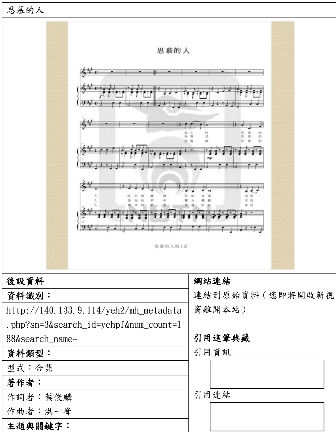
表三、聯合目錄網頁範例

下列為資料對照至聯合目錄後，聯合目錄檢索結果之顯示版面。若無資料匯入的欄位，聯合目錄則不會顯示，請見表三。