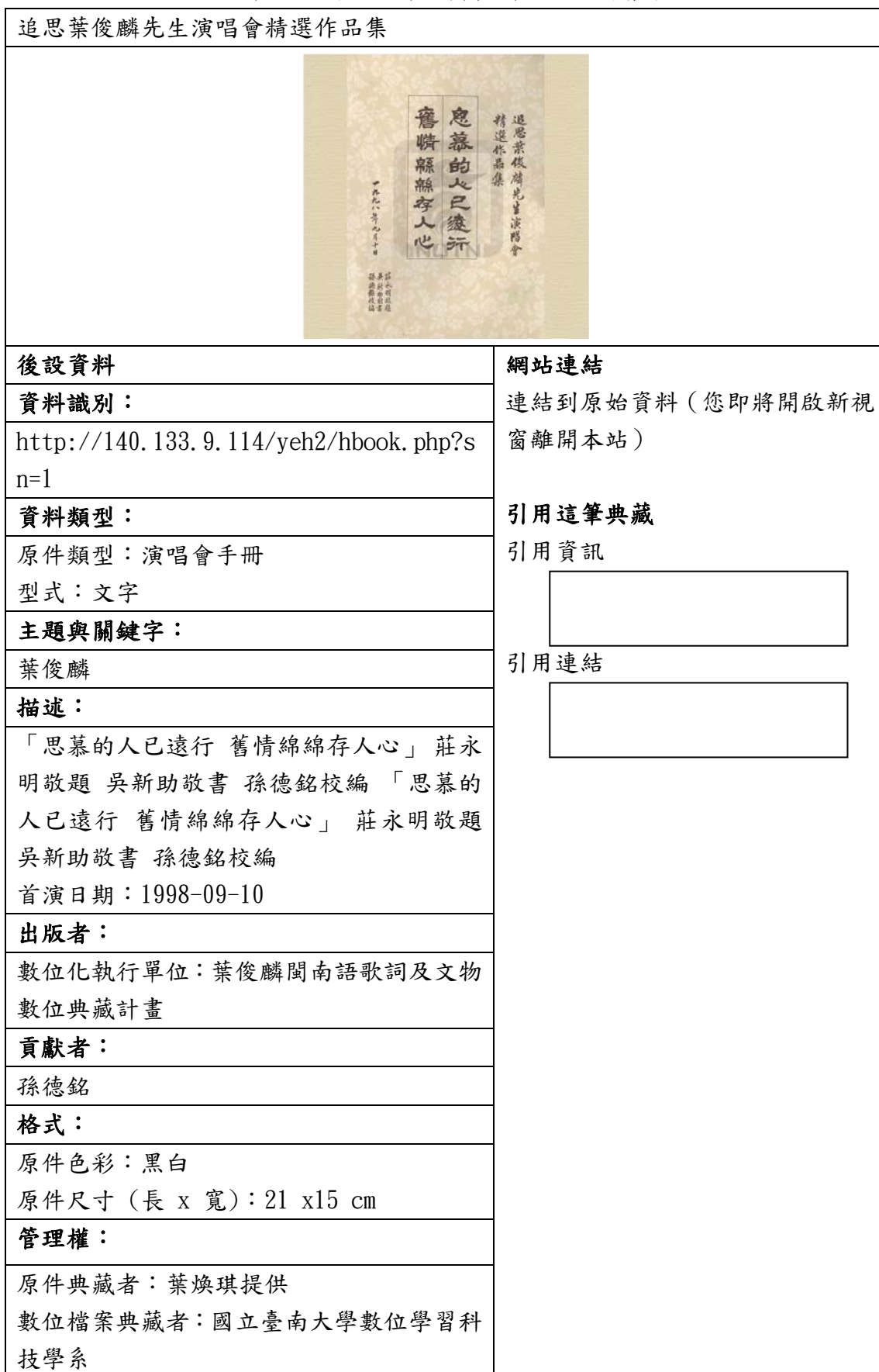
表四、聯合目錄網頁範例二—演唱會手冊