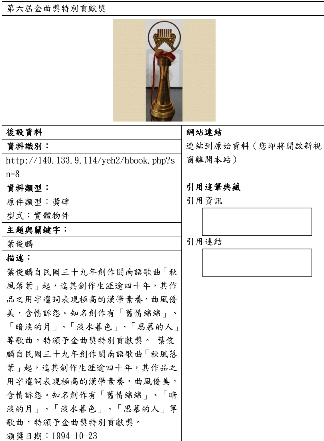
表三、聯合目錄網頁範例一—獎項

下列為資料對照至聯合目錄後，聯合目錄檢索結果之顯示版面。若無資料匯入的欄位，聯合目錄則不會顯示，請見表三至表五。