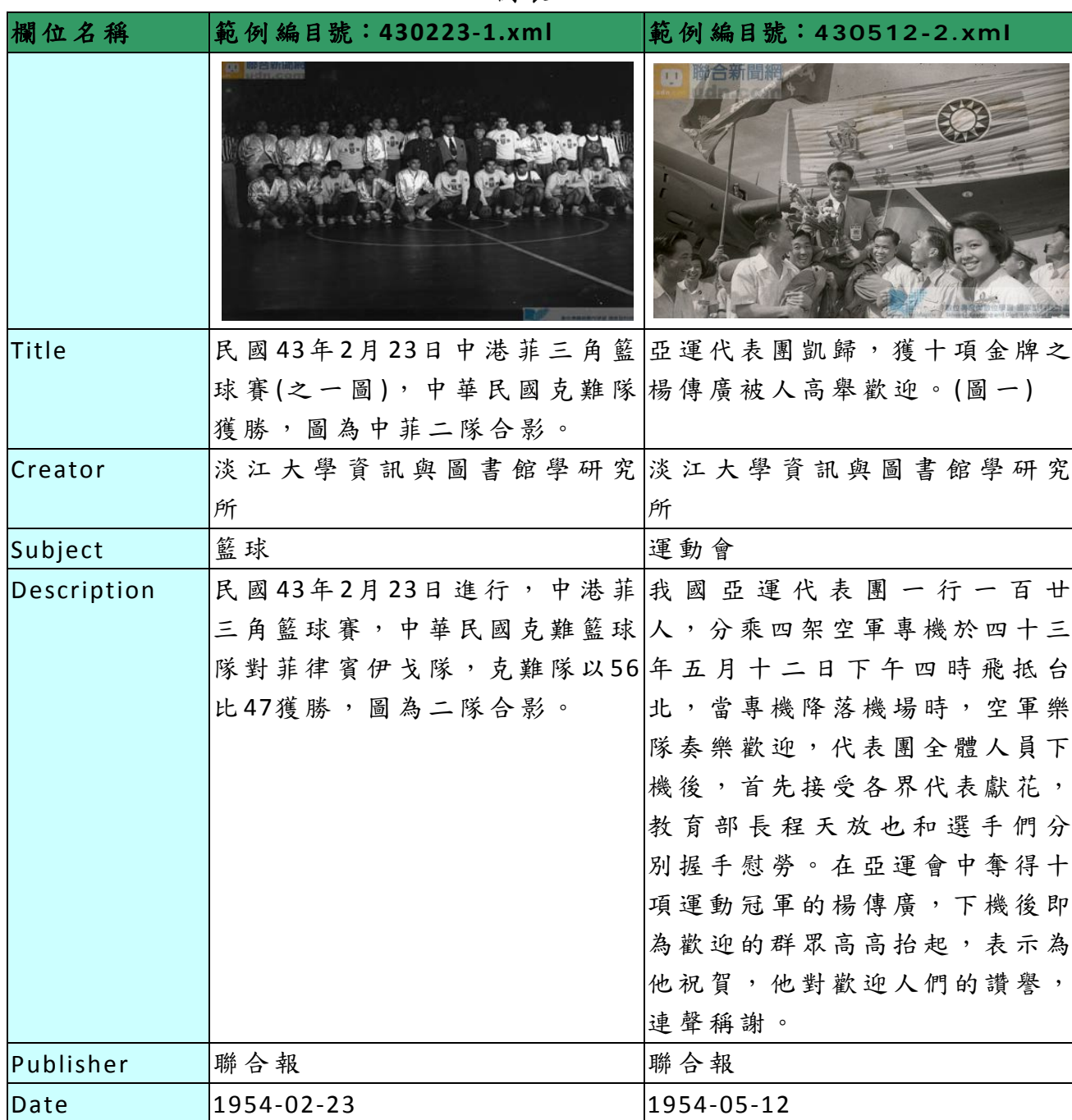
表 1、「運動與棒球文化資產之數位典藏與資源整合(I)」資料庫欄位及範例表

「運動與棒球文化資產之數位典藏與資源整合(I)」主要典藏台灣運動與棒球相關之經典照片，後設資料工作組依據「運動與棒球文化資產之數位典藏與資源整合(I)」於 2011-05-16 提供的欄位及範例，整理出「照片」之欄位及範列表，請見表 1。