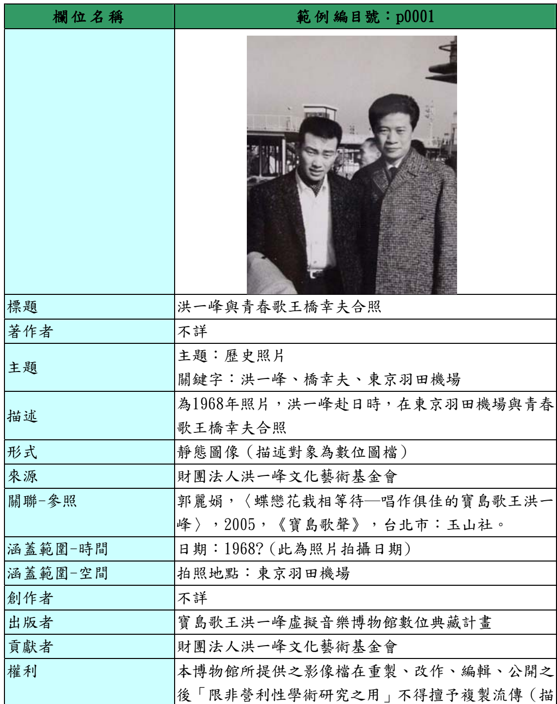
表 1、「寶島歌王洪一峰數位典藏虛擬音樂博物館-照片」資料庫欄位及範例表

「寶島歌王洪一峰數位典藏虛擬音樂博物館」主要典藏洪一峰相關珍貴照片、歌曲、樂譜與報紙四類藏品，後設資料工作組依據「洪一峰數位典藏虛擬音樂博物館」於 2011-03-31 提供的欄位及範例，整理出「照片」之欄位及範列表，請見表 1。