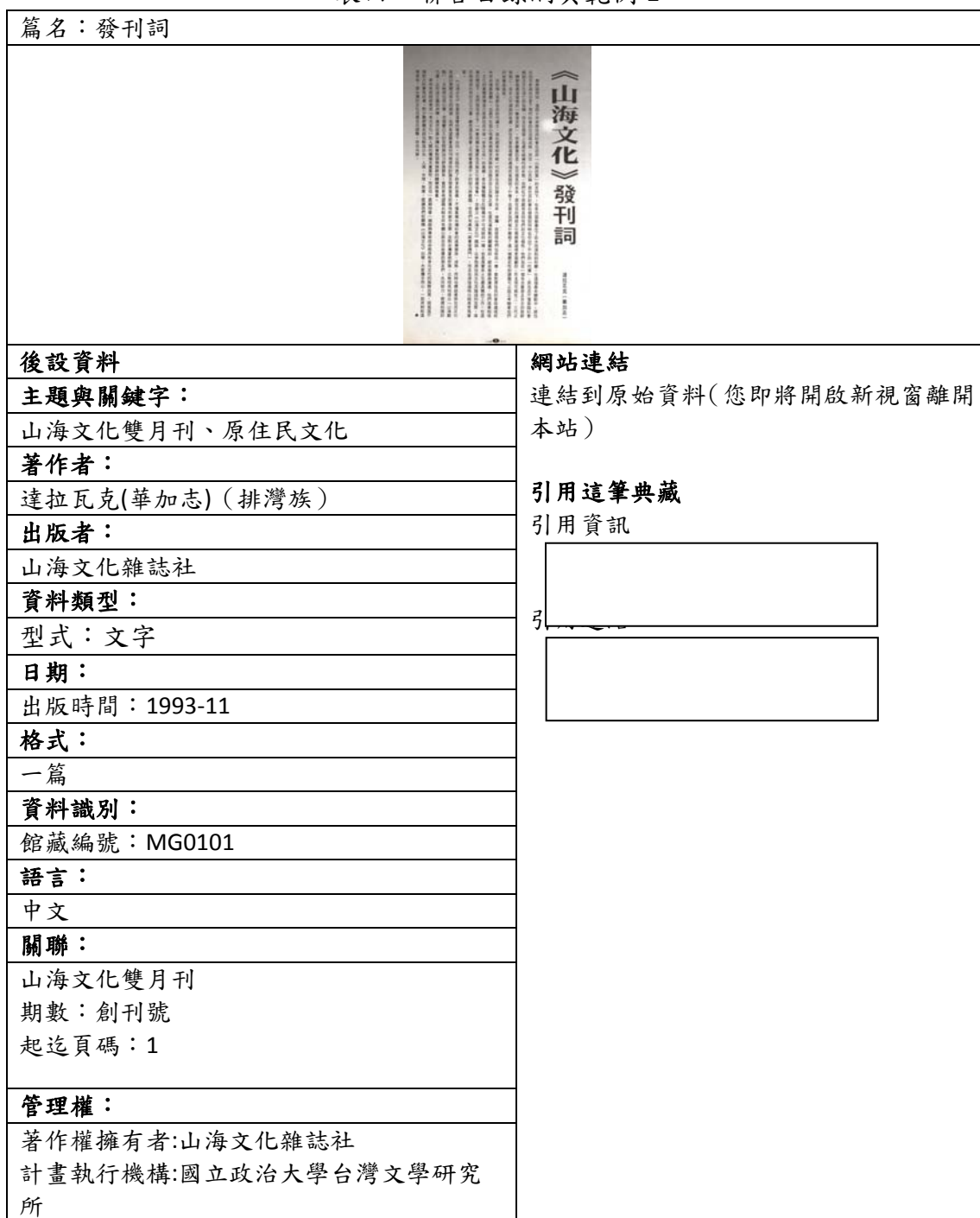
表四、聯合目錄網頁範例 1

下列為資料對照至聯合目錄後，聯合目錄檢索結果之顯示版面，若無資料匯入的欄位，聯合目錄則不會顯示，請見表四與表五。