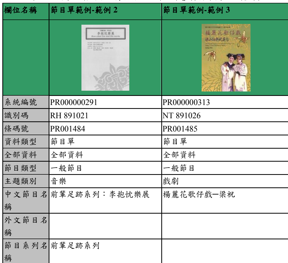
表一、國家兩廳院數位博物館－「節目單」資料庫欄位及範例表

後設資料工作組依據「國家兩廳院數位博物館」2010-12-02 提供的欄位及範例，整理出「節目單」藏品之欄位及範例表，請見表一。