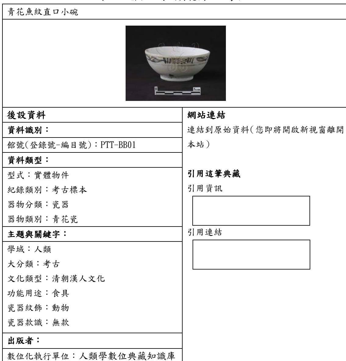
表四、聯合目錄網頁範例二—考古