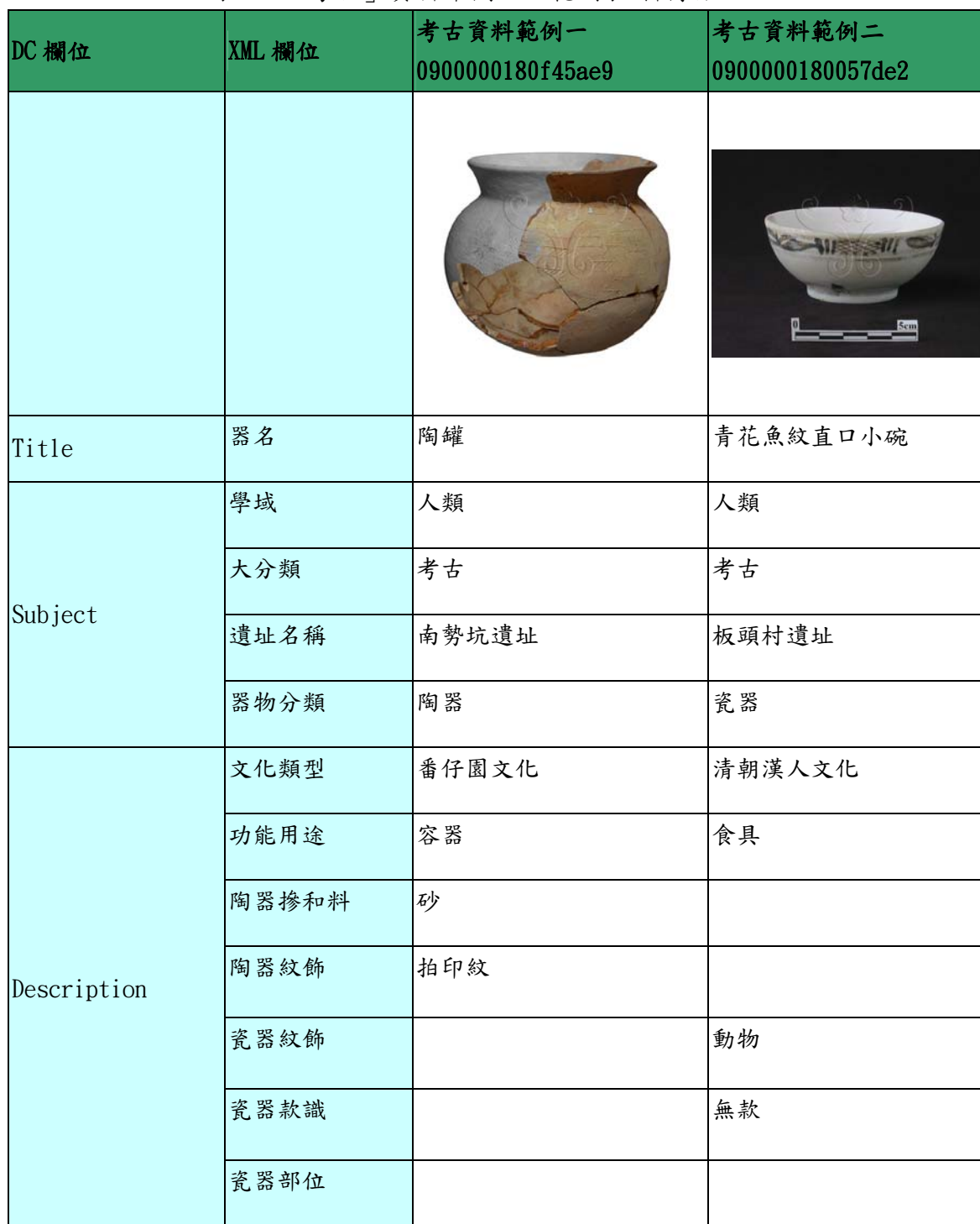
表一、「考古」資料庫欄位及範例表-科博館 XML

後設資料工作組依據「國立自然科學博物館」於 2010-10-21 的回信，提供的範例檔為 XML 檔，其中「考古」的部分以「陶器」與「瓷器」為例 1 進行說明，請見表一。