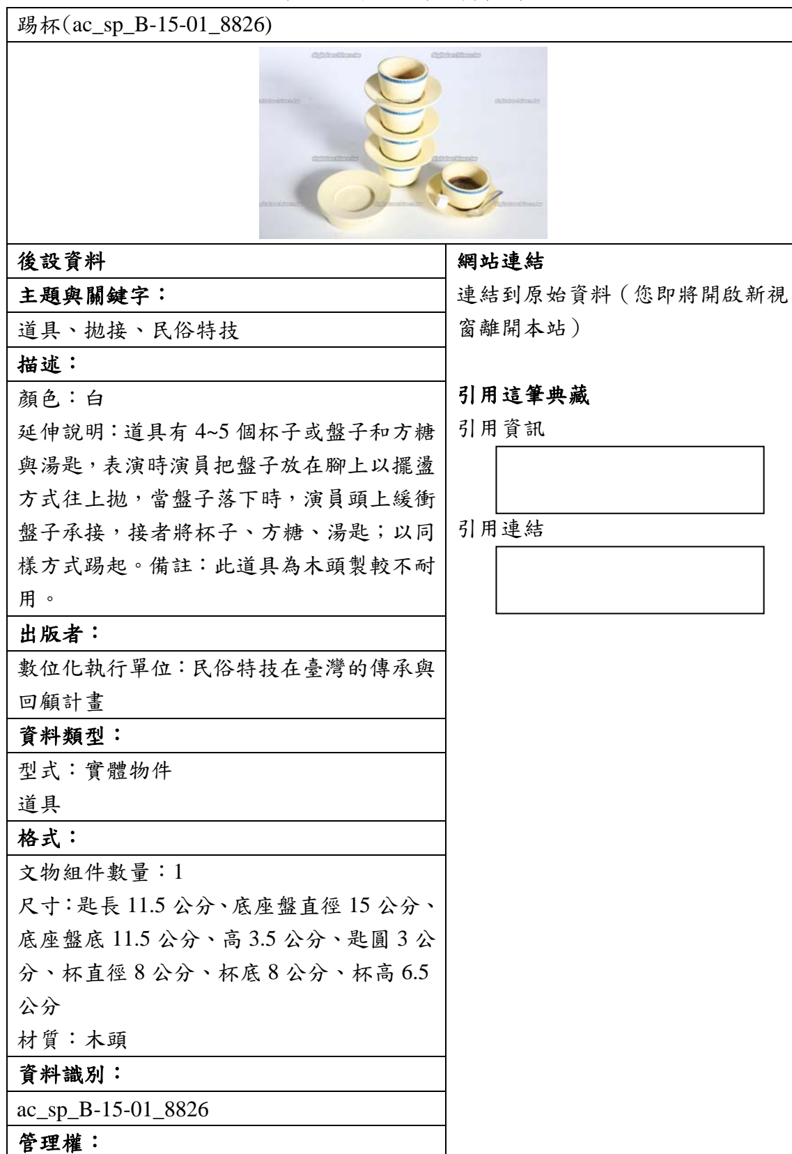
表三、聯合目錄網頁範例

下列為資料對照至聯合目錄後，聯合目錄檢索結果之顯示版面。若無資料匯入的欄位，聯合目錄則不會顯示，請見表三。