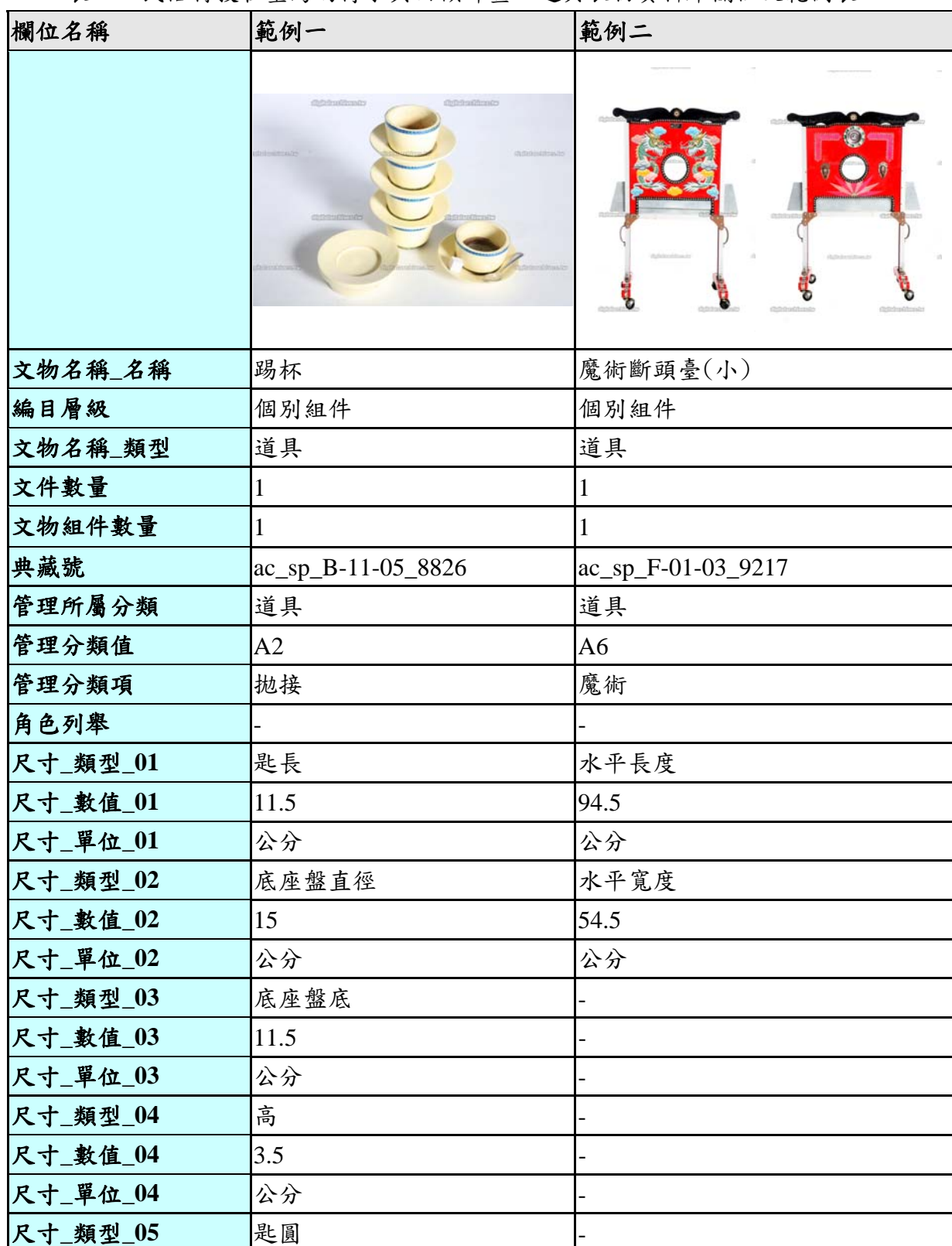
表一、民俗特技在臺灣的傳承與回顧計畫—道具衣物資料庫欄位及範例表

後設資料工作組依據「民俗特技在臺灣的傳承與回顧計畫—道具衣物」2010-11-11提供的欄位及範例，整理出欄位及範例表共4筆，請見表一。