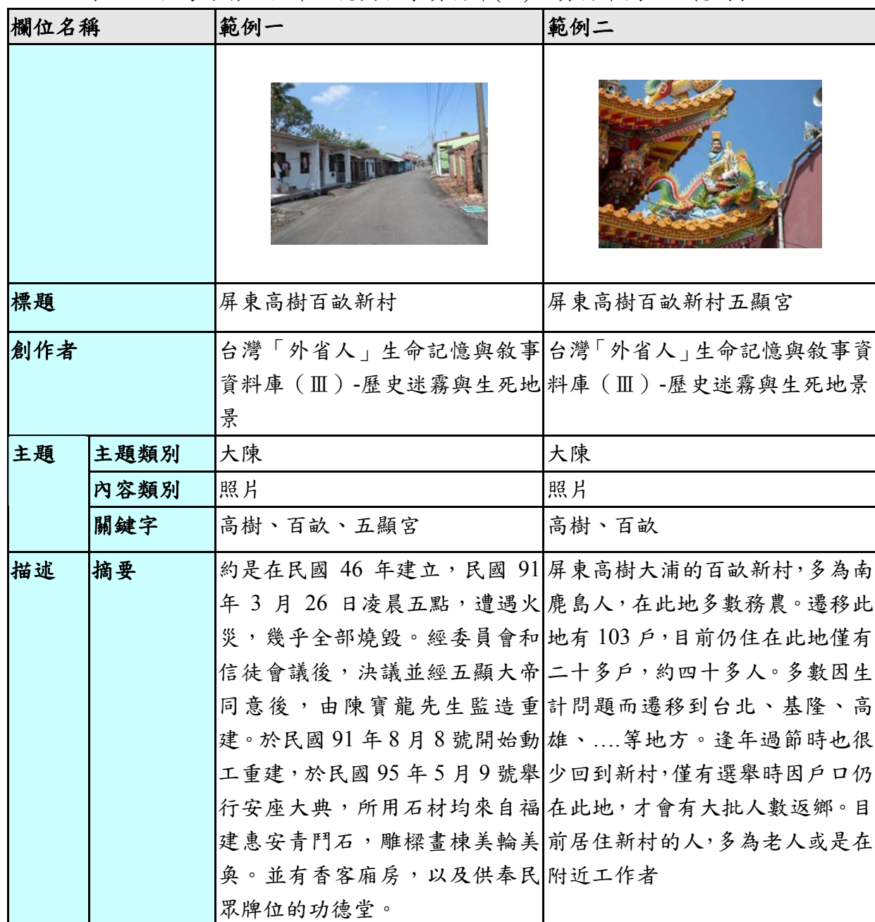
表一、台灣外省人生命記憶與敘事資料庫(III) — 資料庫欄位及範例表

後設資料工作組依據「台灣外省人生命記憶與敘事資料庫(III) — 歷史迷霧與生死地景」2010-08-23 提供的欄位及範例，整理出欄位及範例表共 5 筆，請見表一。