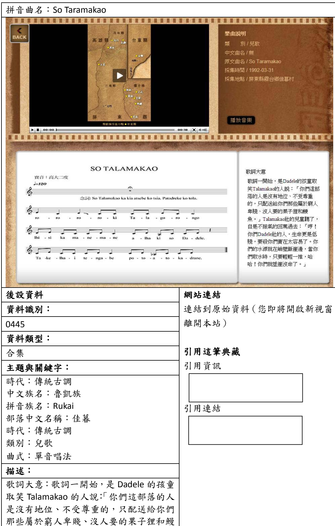
表四、聯合目錄網頁範例（二）