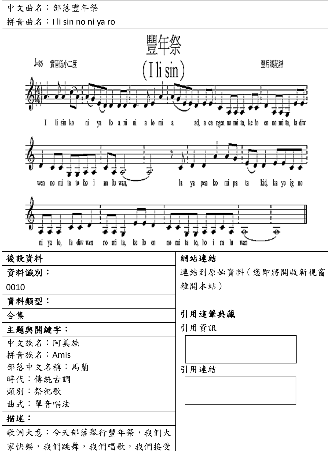
表三、聯合目錄網頁範例（一）

下列為資料對照至聯合目錄後，聯合目錄檢索結果之顯示版面。若無資料匯入的欄位，聯合目錄則不會顯示，請見表三與表四。