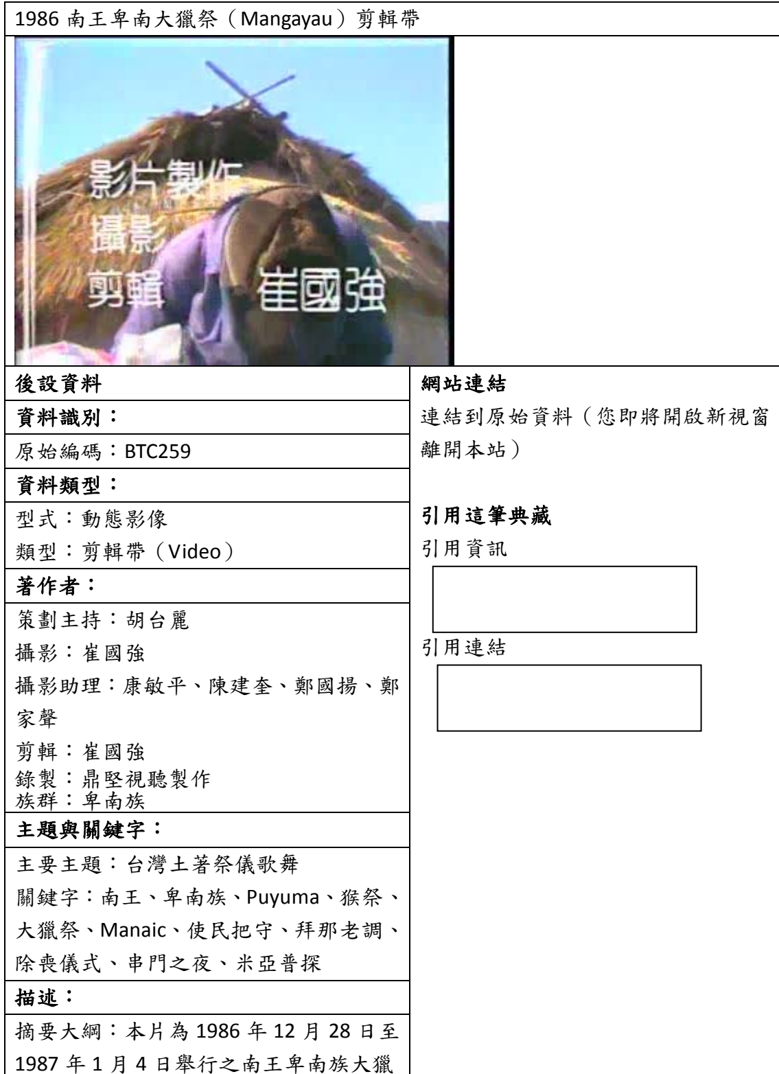
表三、聯合目錄網頁範例

下列為資料對照至聯合目錄後，聯合目錄檢索結果之顯示版面。若無資料匯入的欄位，聯合目錄則不會顯示，請見表三。