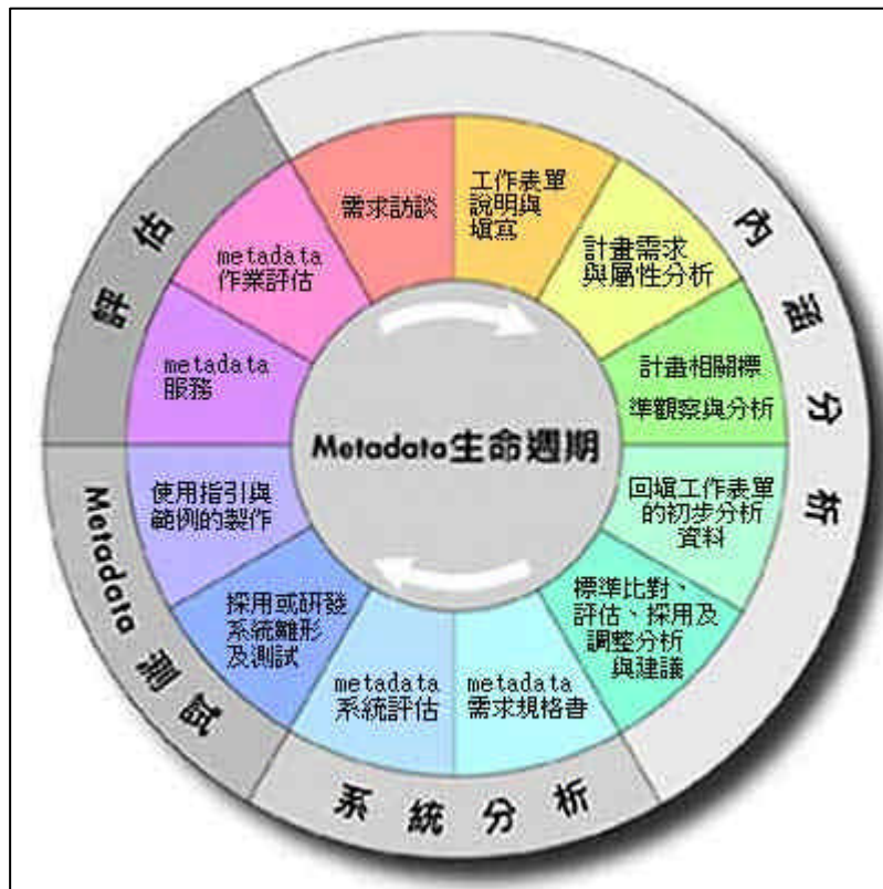
圖 1 後設資料(Metadata)生命週期作業模式