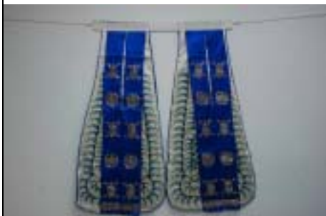
靠拍 ← 靠網 →