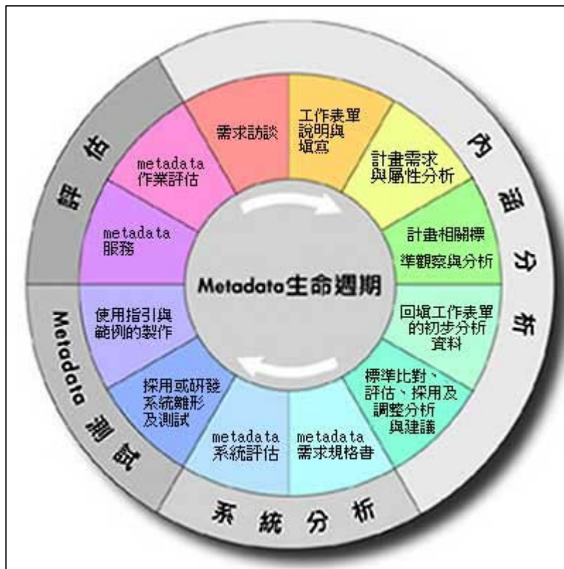
圖 1 後設資料(Metadata)生命週期作業模式