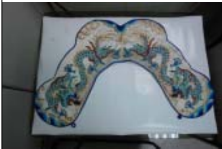
三肩 ← 靠旗 →