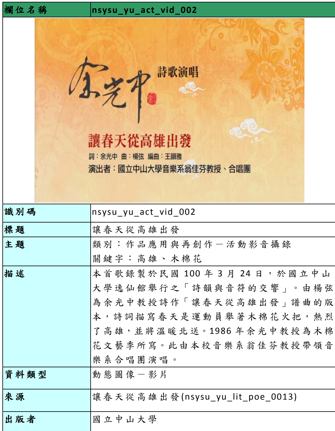
表一、「臺灣書寫，世界發光：余光中數位典藏計畫(影音)」 資料庫欄位及範列表

「臺灣書寫，世界發光：余光中數位典藏計畫」主要典藏余光中珍貴照片、文物等，並透過數位化達到推廣與應用之目的。後設資料工作組依據「臺灣書寫，世界發光：余光中數位典藏計畫」於 2012-03-14 提供的欄位及範例，整理出「影音」之欄位及範列表，請見表一。