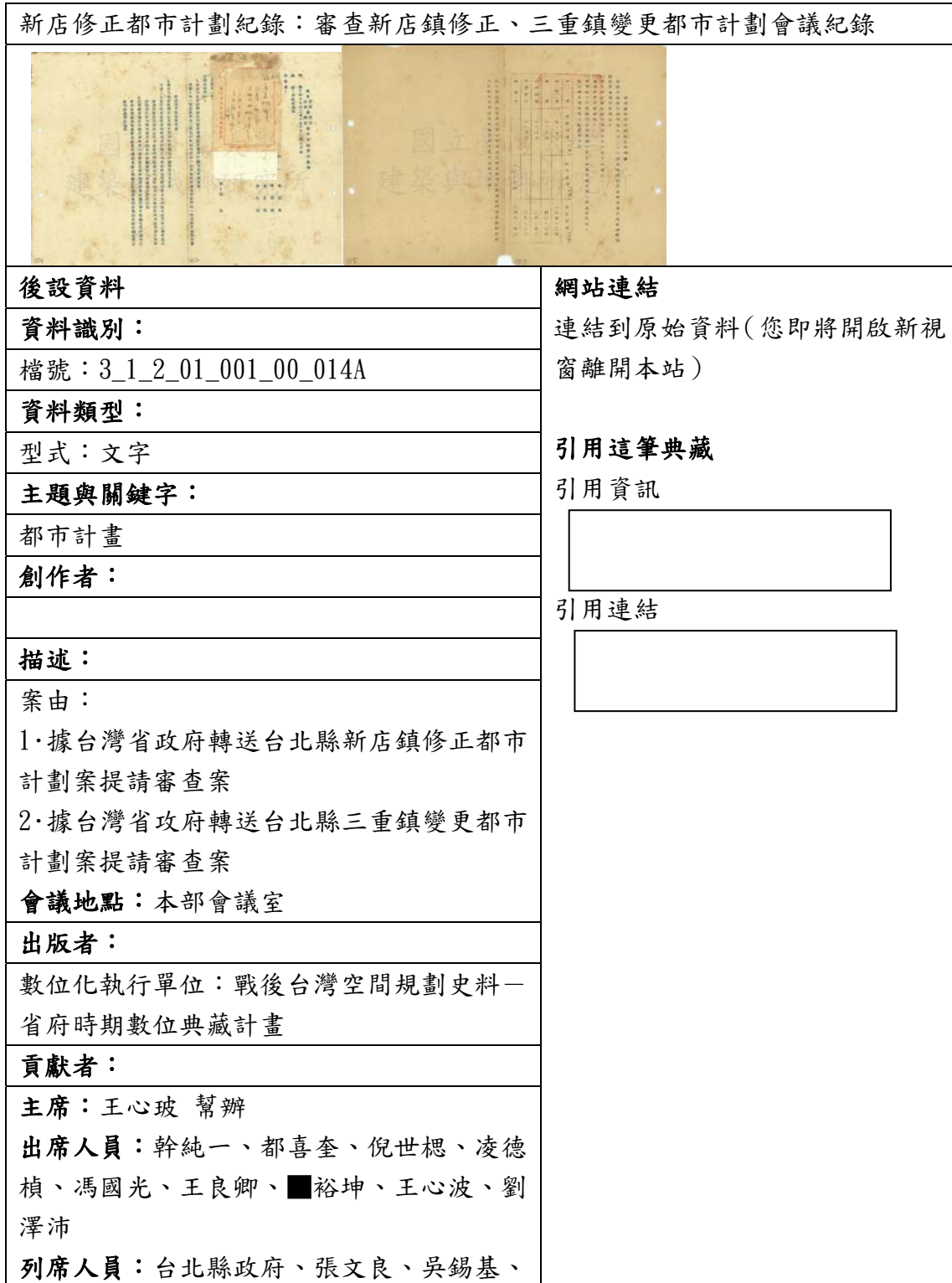
表三、聯合目錄網頁範例一

下列為資料對照至聯合目錄後，聯合目錄檢索結果之顯示版面。若無資料匯入的欄位，聯合目錄則不會顯示，請見表三。