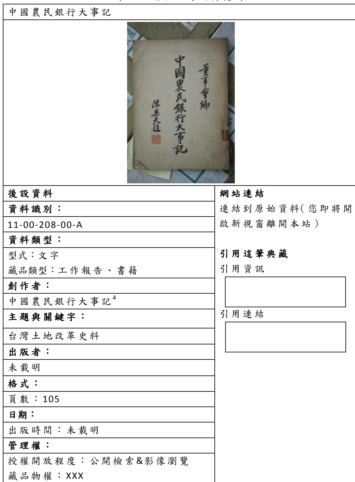
表三、聯合目錄網頁範例

下列為資料對照至聯合目錄後，聯合目錄檢索結果之顯示版面。若無資料匯入的欄位，聯合目錄則不會顯示，請見表三。