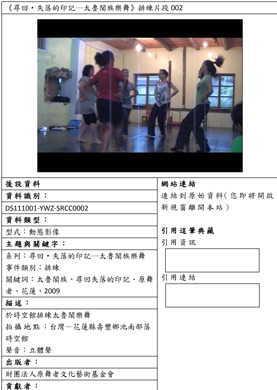
表三、聯合目錄網頁範例(範例一)

下列為資料對照至聯合目錄後，聯合目錄檢索結果之顯示版面。若無資料匯入的欄位，聯合目錄則不會顯示，請見表三。