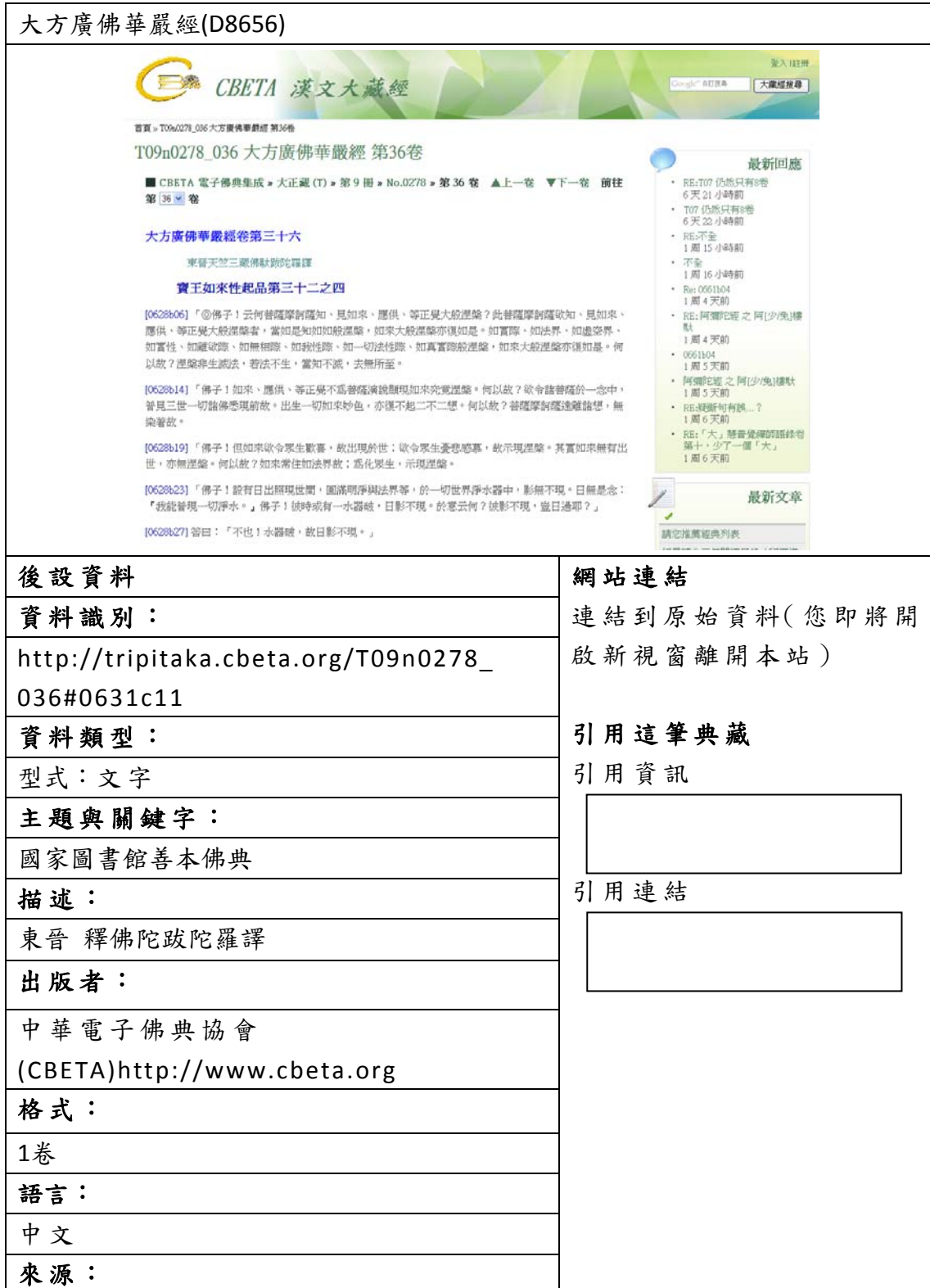
表三、聯合目錄網頁範例

下列為資料對照至聯合目錄後，聯合目錄檢索結果之顯示版面。若無資料匯入的欄位，聯合目錄則不會顯示，請見表三。