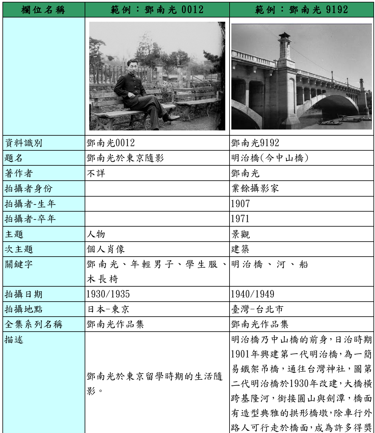
表一、「尋找台灣攝影文化的歷史座標－Part 1 日治時期的營業寫真館及業餘愛好者(1895～1945) 作品蒐研暨數位典藏計劃」(第二年) 資料庫欄位及範例表

後設資料工作組依據「尋找台灣攝影文化的歷史座標－Part 1 日治時期的營業寫真館及業餘愛好者(1895～1945) 作品蒐研暨數位典藏計劃」(第二年)」於 2010-11-07 提供的資料整理出攝影作品之欄位及範例表，請見表一。