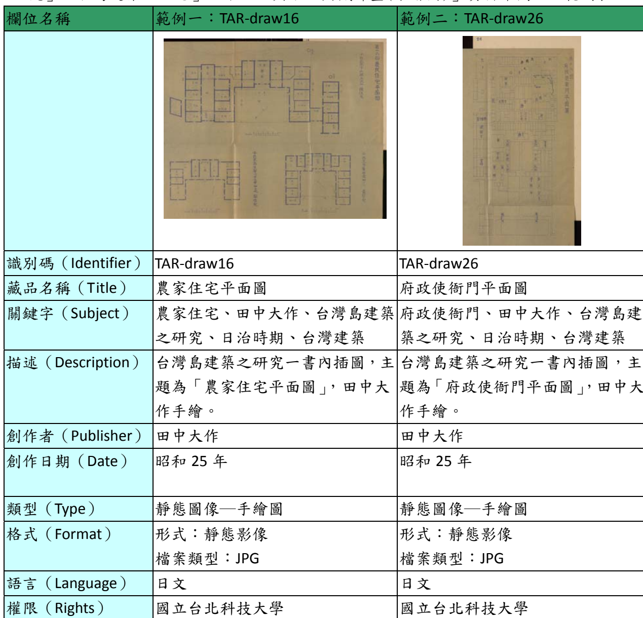
表一、「日治時期台北工業學校建築學者田中大作先生研究成果「台灣島建築之研究」、「台灣建築文化志」之中文化與數位典藏計畫(手繪圖)」資料庫欄位及範例表

後設資料工作組依據「日治時期台北工業學校建築學者田中大作先生研究成果「台灣島建築之研究」、「台灣建築文化志」之中文化與數位典藏計畫」於 2011-07-25 提供的欄位及範例，整理出「原件內文」、「內文翻譯檔」、「手繪圖」、「照片」、四類藏品，「照片」之欄位及範例表，請見表 1。