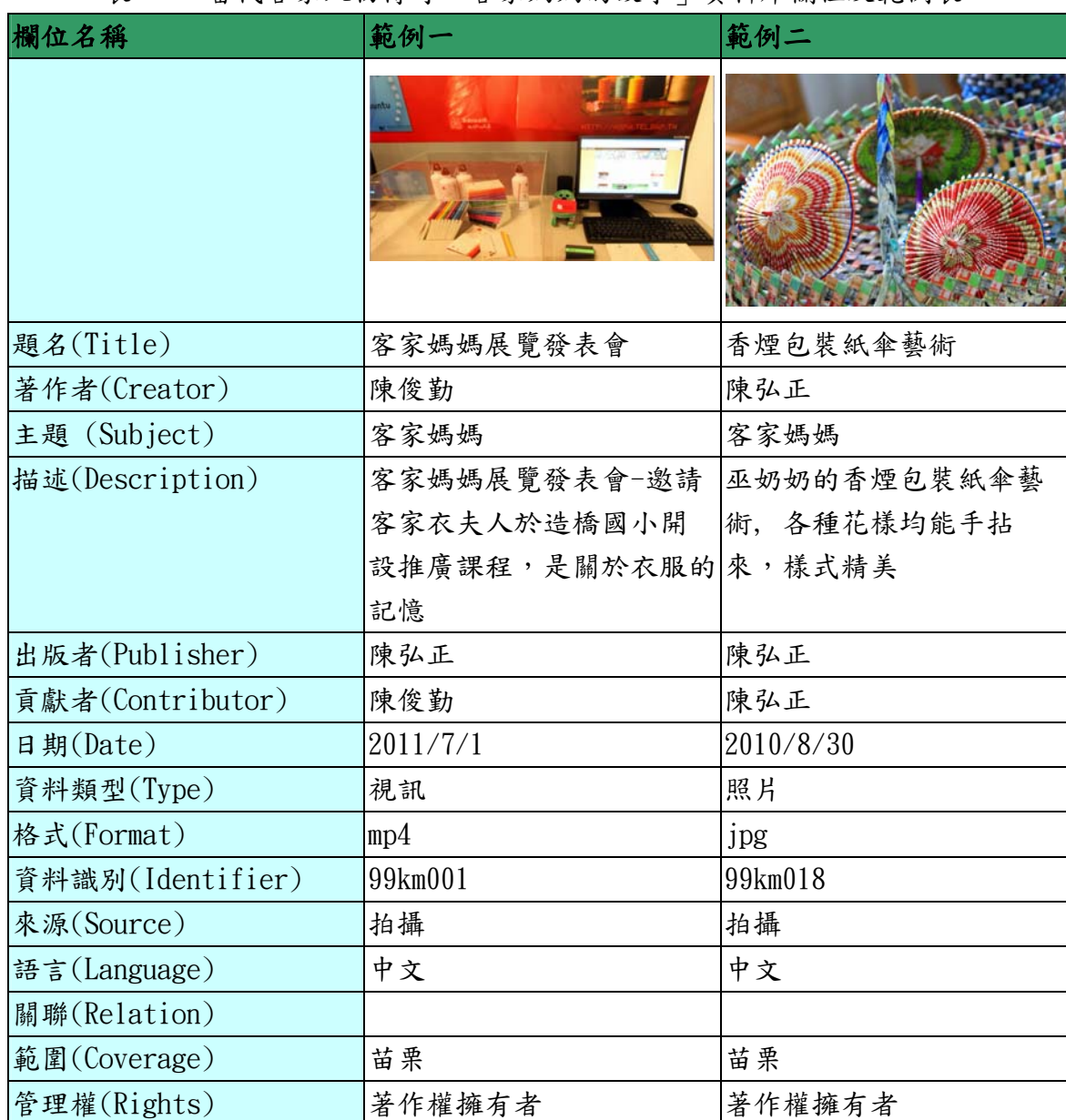
表一、「當代客家人物傳奇－客家媽媽的故事」資料庫欄位及範例表

後設資料工作組依據「當代客家人物傳奇－客家媽媽的故事」計畫於2011-07-18提供的欄位及範例，整理出計畫欄位及範例表，請見表一。