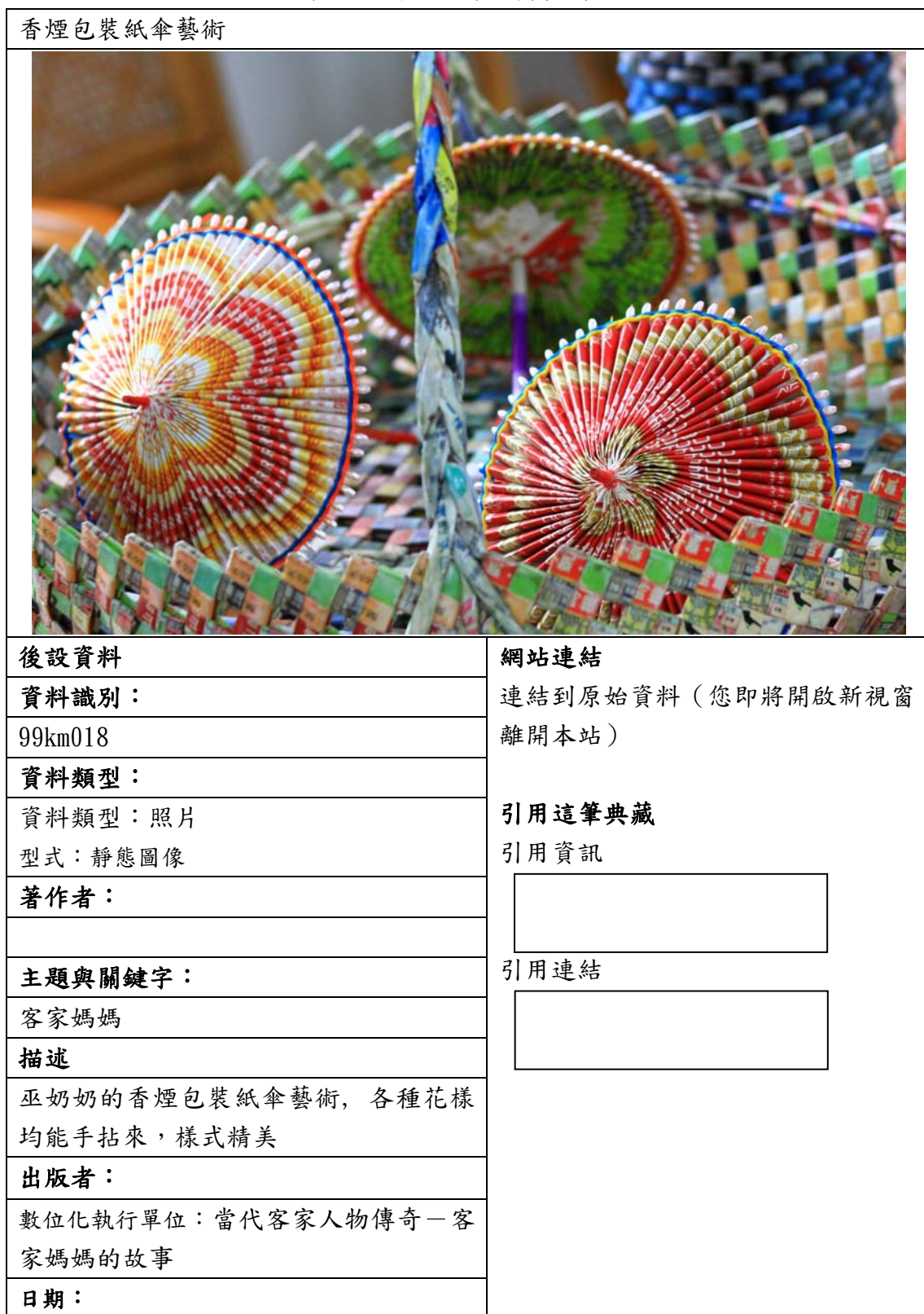
表四、聯合目錄網頁範例二