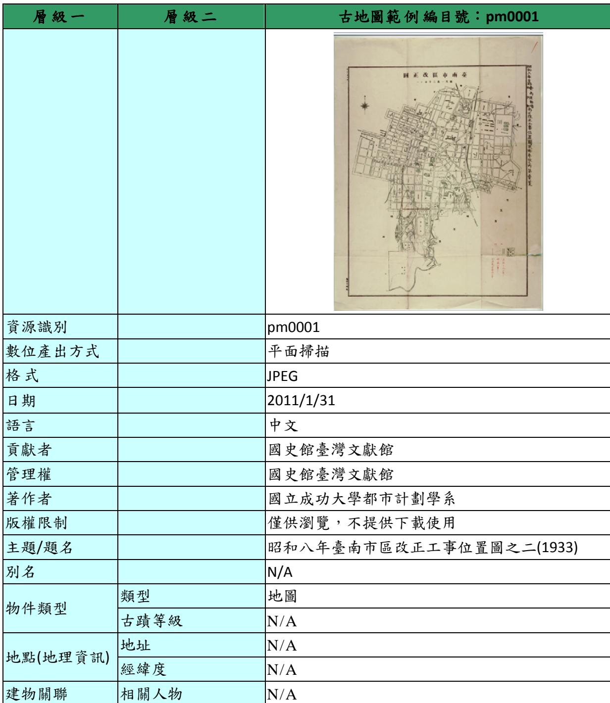
表 1、「台南總爺老街數位典藏計畫-古地圖」資料庫欄位及範例表

「台南總爺老街數位典藏計畫後設資料對照報告」主要典藏台南市”總爺老街”相關古地圖、歷史建築與訪談影音檔案等藏品，後設資料工作組依據「台南總爺老街數位典藏計畫」於 2011-06-29 提供的欄位及範例，整理出「古地圖」、「實體建築」、「測繪圖、虛擬模型」、「訪談影音檔」四類藏品，「古地圖」之欄位及範例表，請見表 1。