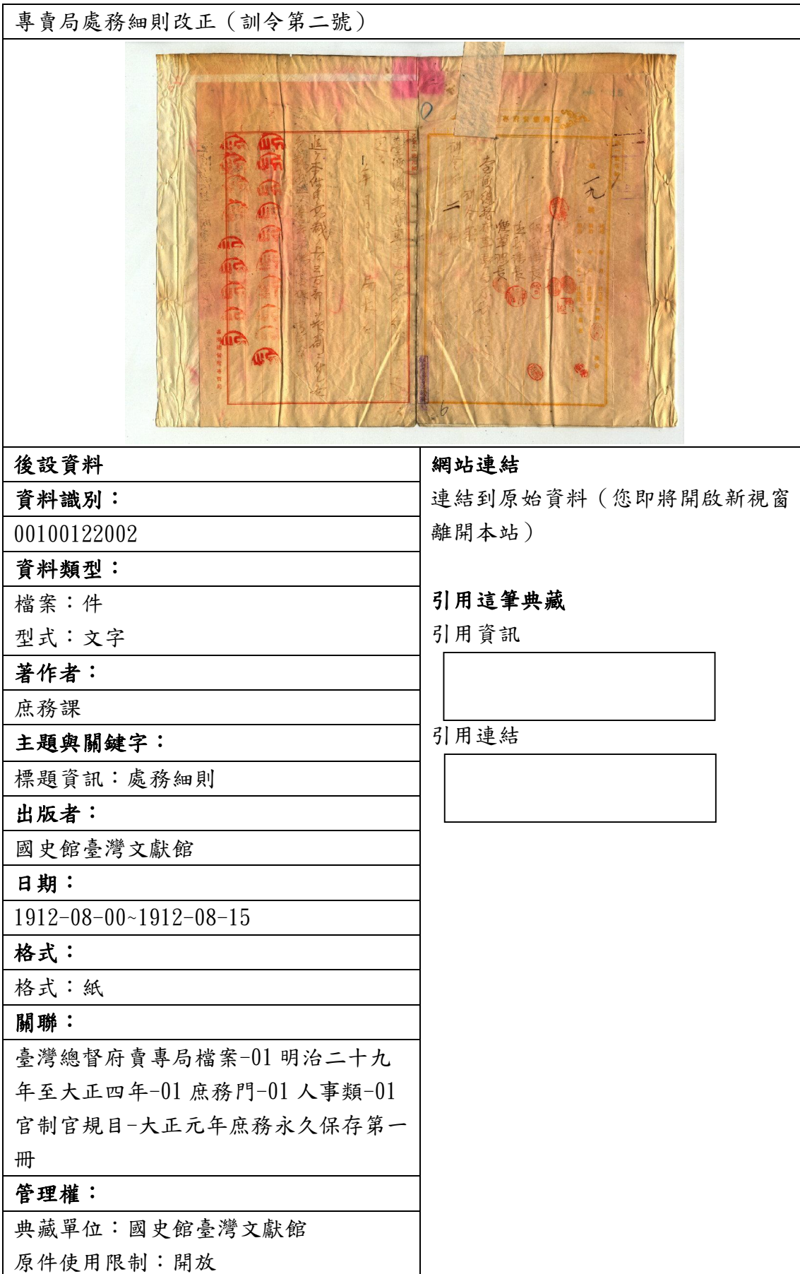
表四、聯合目錄網頁範例—台灣總督府專賣局檔案