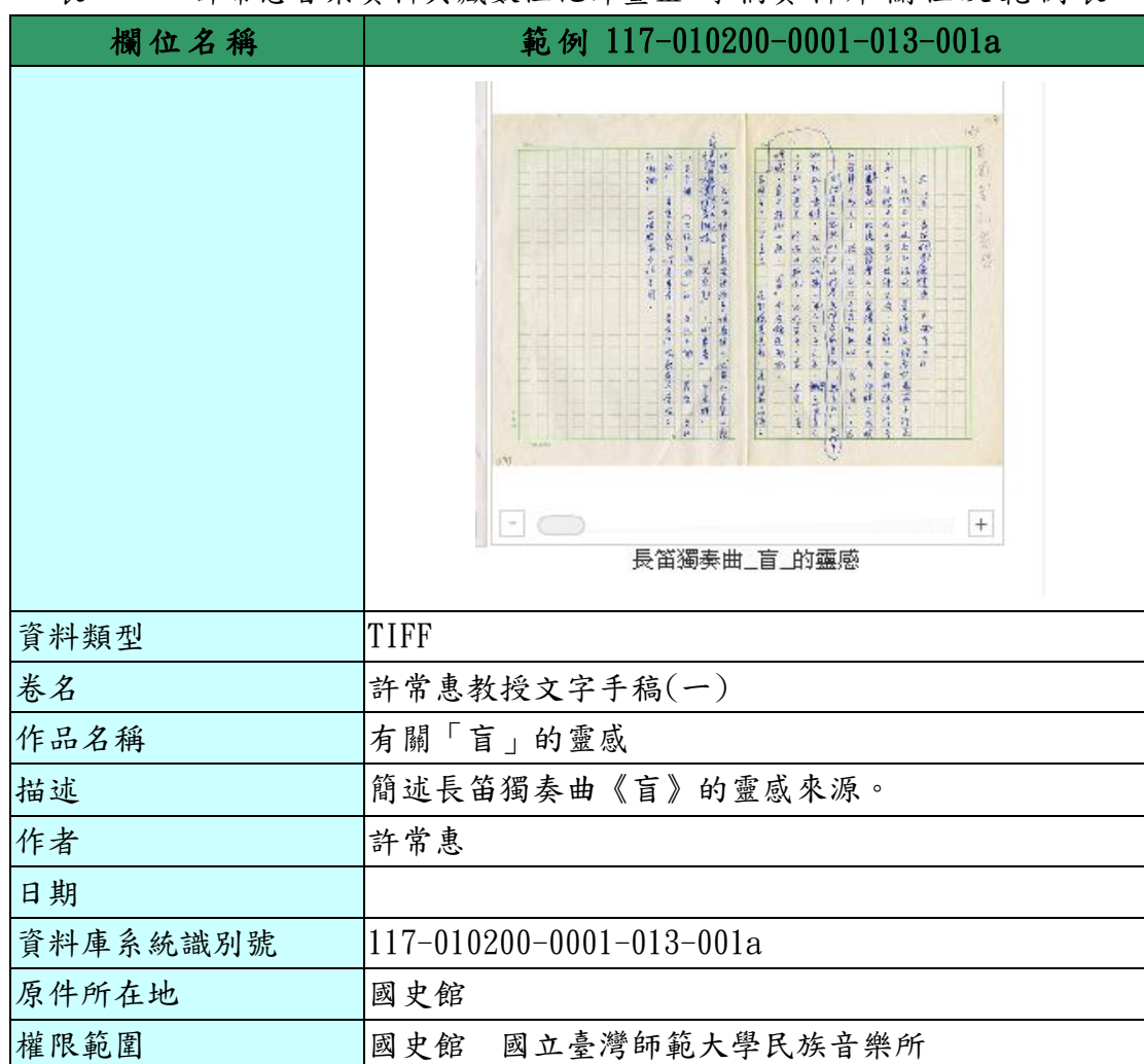
表 1-1、許常惠音樂資料典藏數位化計畫Ⅲ-手稿資料庫欄位及範例表

後設資料工作組依據「許常惠音樂資料典藏數位化計畫Ⅲ」於2010-10-13提供的欄位及範例，整理出攝影作品之欄位及範例表，請見表 1-1。