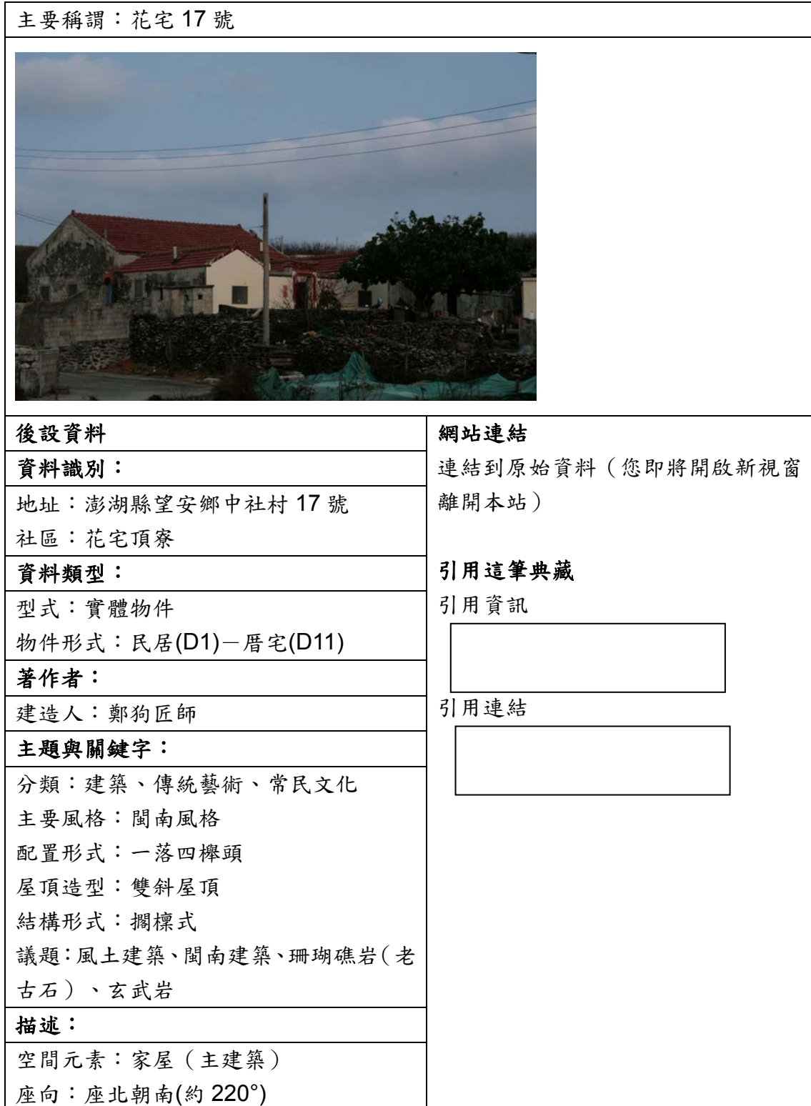
表三、聯合目錄網頁範例

下列為資料對照至聯合目錄後，聯合目錄檢索結果之顯示版面。若無資料匯入的欄位，聯合目錄則不會顯示，請見表三。