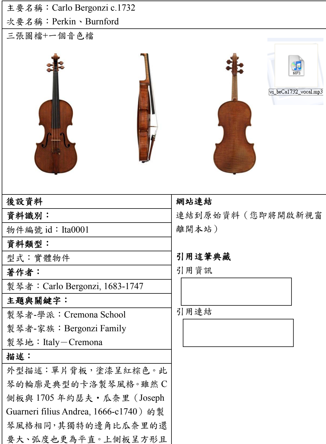
表三、聯合目錄網頁範例

下列為資料對照至聯合目錄後，聯合目錄檢索結果之顯示版面。若無資料匯入的欄位，聯合目錄則不會顯示，請見表三。